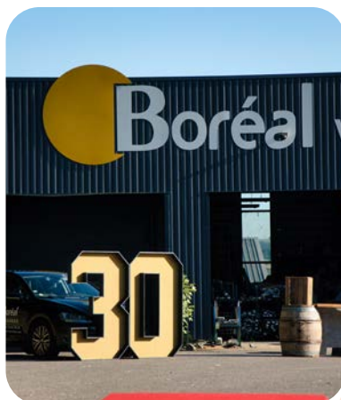
Doc: Profils Systèmes